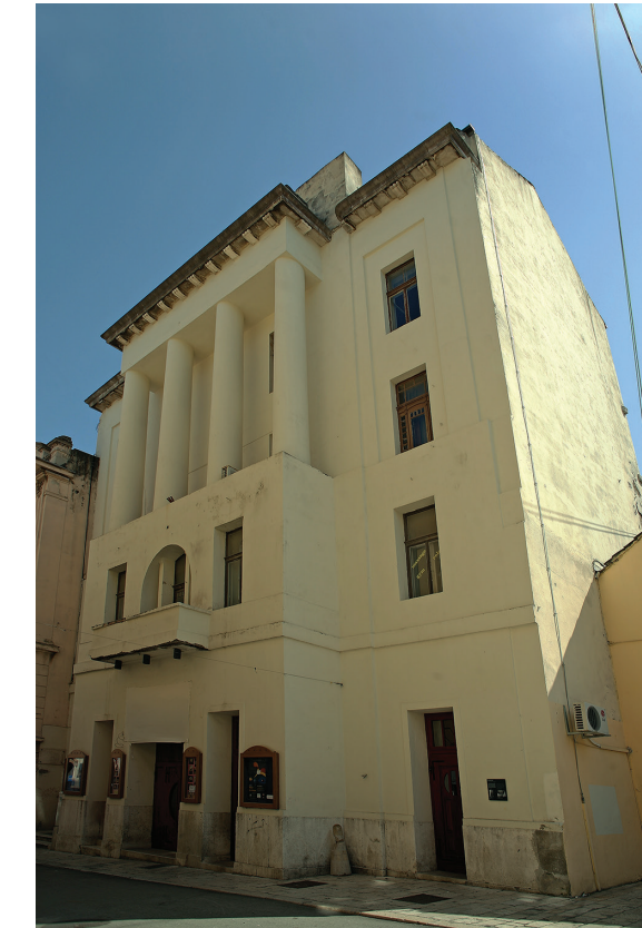
Hrvatski dom, foto: Valentino Bilić Prčić, 2011.

Pripreme za obnovu zgrade započele su 2005. godine uz jasnu ideju o njezinoj budućoj namjeni kojom bi uz kazalište lutaka u prizemlju i polivalentnu koncertnu dvoranu na katu svi ostali prostori bili u funkciji koncertne djelatnosti. Iako spomeničkoj važnosti