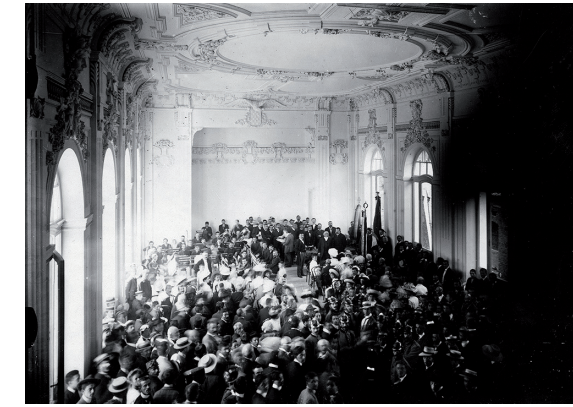
Okupljanje narodnjačkih društava u svečanoj dvorani, foto: Ante Katunarić, između 1908. i 1914.

Tijekom Drugog svjetskog rata talijanski su fašisti uklonili ukrase s glavnog pročelja zgrade, tada sjedišta talijanske mladeži. U ranom poraću iz političkih razloga obezvrjeđuje se Tončićevo djelo pa su u preuređenju Omladinskog doma, 1947. godine, uklonjeni ukrasi interijera svečane dvorane na prvom katu čime je u potpunosti promijenjen njezin izvorni arhitektonski izgled.