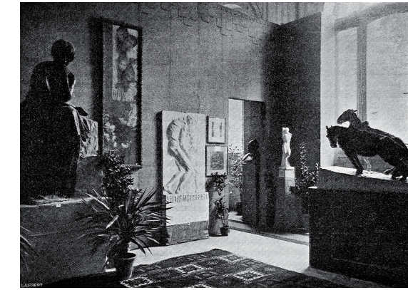
Postav Prve dalmatinske umjetničke izložbe, 1908.