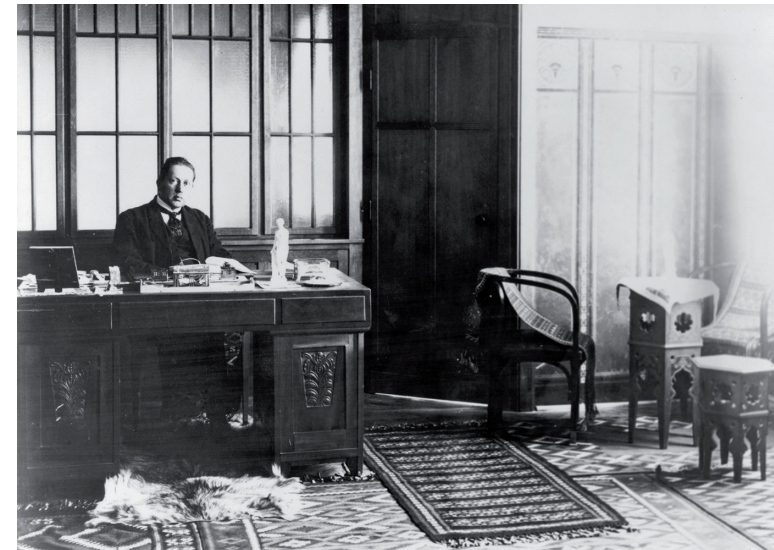
Kamilu Tončiću u radnoj sobi, između 1930. i 1935.

bila fotografija, oblikovanje svakog elementa zahtijevalo je kreativan kiparski nerv i osjećaj za prostor. Za modeliranje onih elemenata koji nisu bili jasni na fotografijama trebalo je poznavati komparativne primjere, prvenstveno Tončićev vokabular sačuvan na zgradi Sumpornog kupališta. Kompleksni proces obnove Hrvatskog doma, počevši od valorizacije Tončićeva djela, preko osmišljavanja projektnog programa, izrade dvodimenzionalnih crteža izvornog izgleda temeljem povijesnih fotografija, izrade projektne dokumentacije, usmjeravanja i provedbe konzervatorsko-restauratorskih istraživanja kojima su potvrđeni rijetki otisci dekorativnih elemenata i izvorne boje, izbora graditeljskih materijala i detalja do same izvedbe, proveli su stručnjaci različitih profila. Tako je rad na obnovi zgrade prema povijesnim fotografijama rezultirao arhitektonskom i kiparskom interpretacijom Tončićeva projekta, svojevrsnim autorskim djelom tima stručnjaka predvođenih konzervatorima i restauratorima. Uključivanje obnovljenog i suvremeno opremljenog koncertnog prostora Hrvatskog doma u kulturni život današnjeg Splita ujedno je i hommage našem zaslužnom sugrađaninu Kamilu Tončiću.