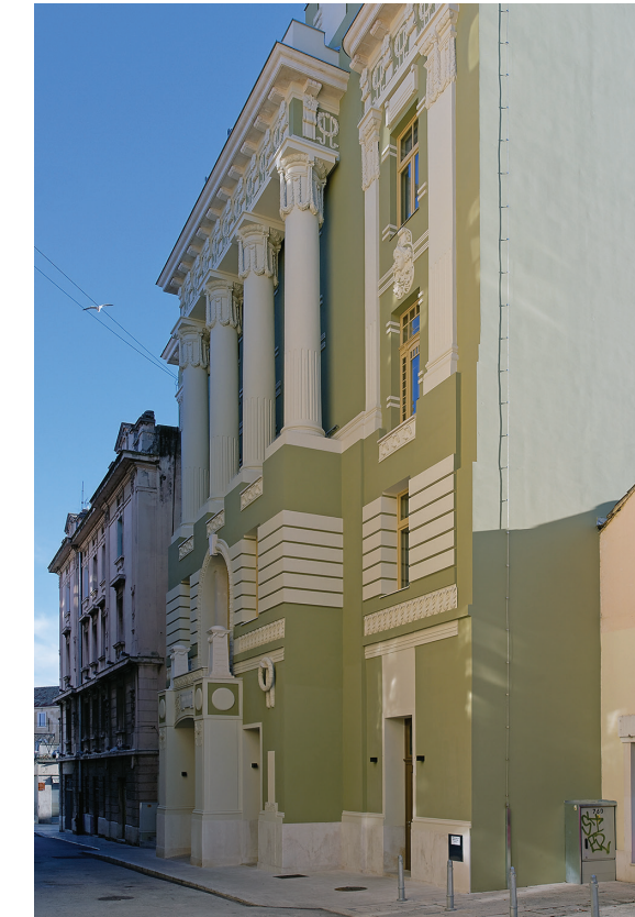
Hrvatski dom, foto: Viktor Popović, 2020.

ove zgrade pridonosi njena uloga u društvenoj, kulturnoj, sportskoj pa i političkoj povijesti grada, njezina je najveća vrijednost upravo Tončićev projekt koji je donio nova strujanja u splitsku arhitekturu.